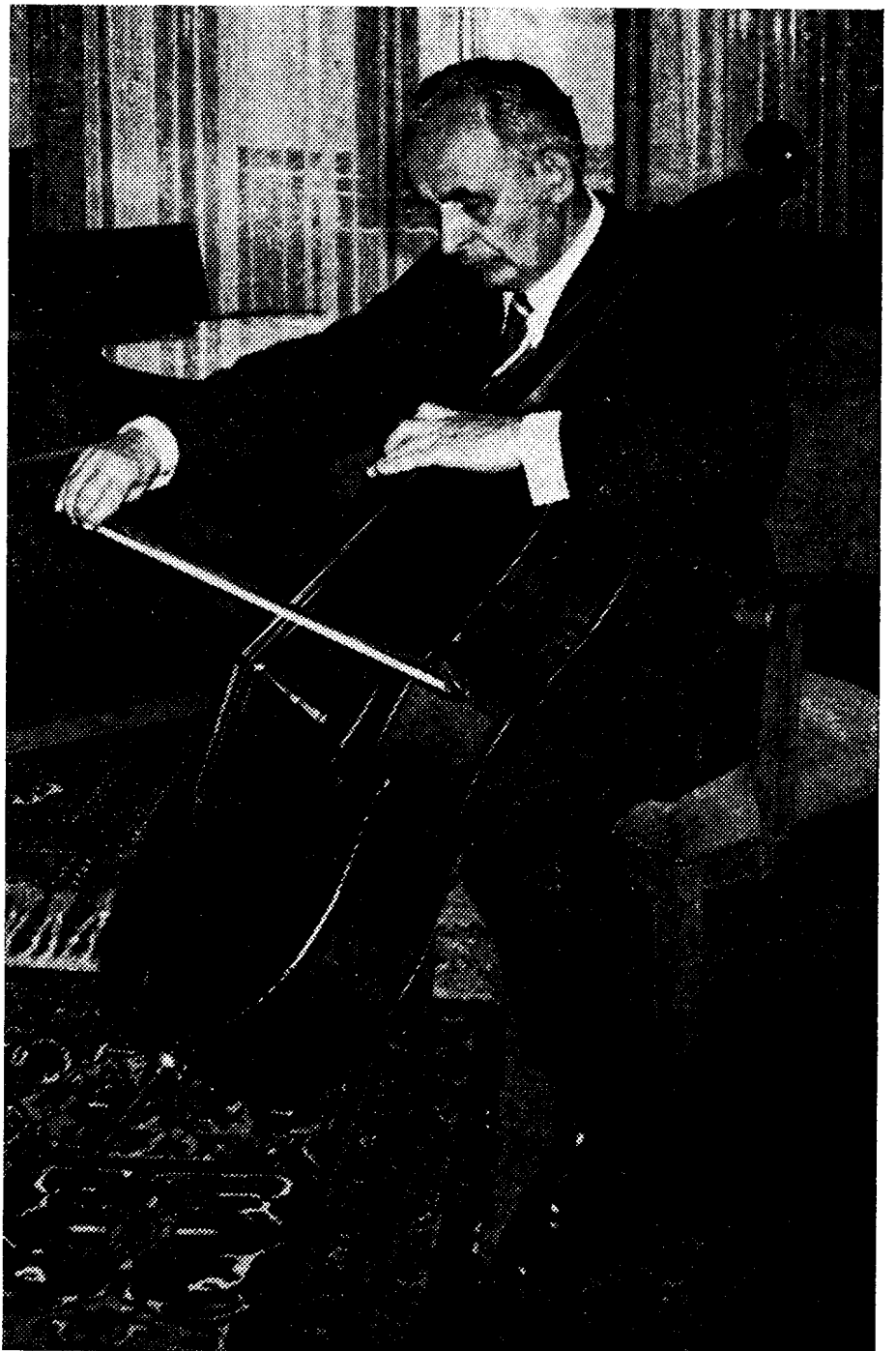
Na prezídiu ČSAV 6. 5. 1976.

mohl od jara 1934, kdy mi končila vojenská služba v Mukačevě, pokračovat ve vědecké práci ve fyzice a nechuť stát se učitelem na měšťance (tam začali učit mnozí kolegové aprobovaní pro matematiku-fyziku, způsobily, že jsem přijal místo paušalisty ve Státním geofyzikálním ústavu (SGÚ) a začal pracovat v geofyzice, především jako seismik, ale také