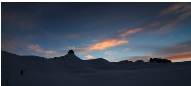
slunce zapadá za horou Spitzmeilen

modré oblohy a skalnatý hřeben v dáli. Cože? Ono se to nakonec roztrhlo? V mžiku jsme před chatou, rozhlížíme se, fotíme, a konečně získáváme představu, kam jsme to došli. Jsme na sněžné pláni, pod námi je horská dolina, za ní skalnatý hřeben, a na druhé straně jde pláň pod skalní štíty, které by i v létě vypadaly na kvalitní horolezecký terén. No, to člověka mohlo napadnout, že když v mapě je nápis Spitzmeilen, navíc celý začáraný hnědýma čarama, že to asi bude špičaté.