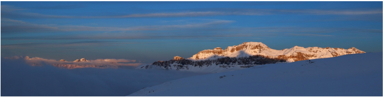
na sněžnicích u Spitzmeilenhütte, mlha se právě roztrhla