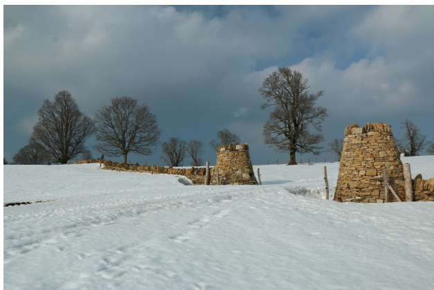
Kamenné zídky okolo pastvin

K východišti tras se vracím se západem slunce. Na zdvižený palec reaguje první auto, nepočítám-li ty co jen popojíždí po vesnici a tváří se lítostivě, že mě nemohou vzít. Jsem docela vděčný, že mě zavezli až k nádraží, jsem po nějakých 35 km v ne-optimálních sněhových podmínkách a pěti navrch pěšky celkem utahaný. A také hladový, chleby s hummusem a koriandrem zůstaly na kuchyňské lince, tak jsem celý dnešek jen o troše vloček, čokoládě a sušených třešní (díky za ně:)). Ještě že na švýcarském nádraží, kde ani není otevřená pokladna (proč taky, když automat umí všechny myslitelné jízdenky a bere mince i platební karty), je otevřená samoobsluha.